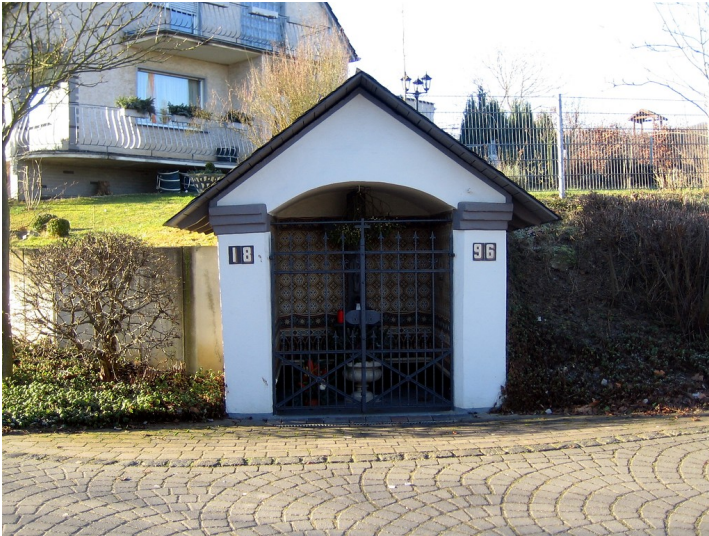
Kapelle am "Fallder" in Sinzig-Westum (2013)