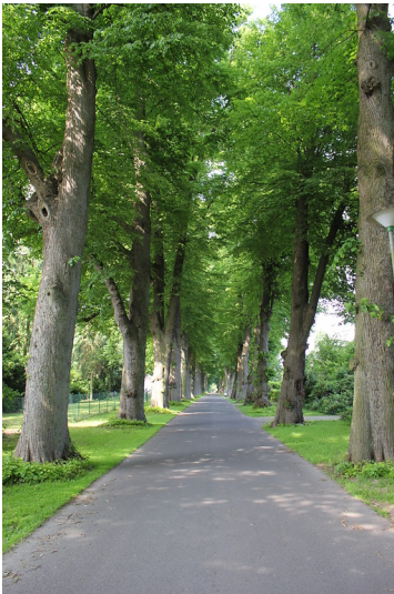
Lindenallee „Am Jäger“ in Diersfordt (2012)