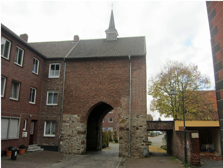
Roßtor in Wassenberg, Innenseite (2012)