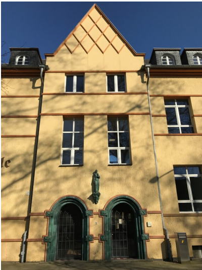
Eingangportal der Ringschule mit Schmuckfassade in Frechen (2020)