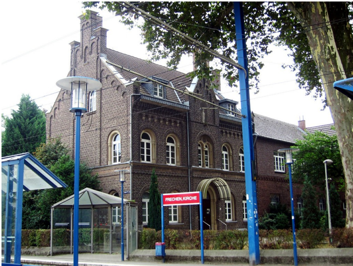
Katholisches Pfarrhaus St. Audomar in Frechen von der Hauptstraße aus (2013)