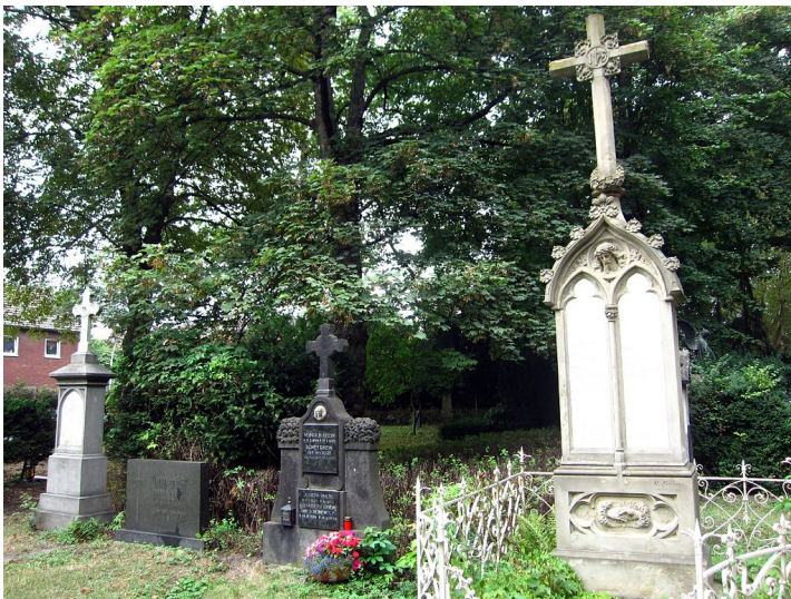
Grabmale auf dem Kirchhof an St. Audomar in Frechen (2013)