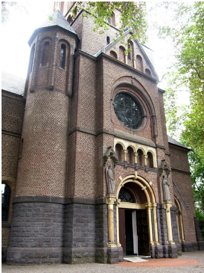
Die Westfassade mit dem unteren Teil des Kirchturms der katholischen Pfarrkirche St. Audomar in Frechen (2013).