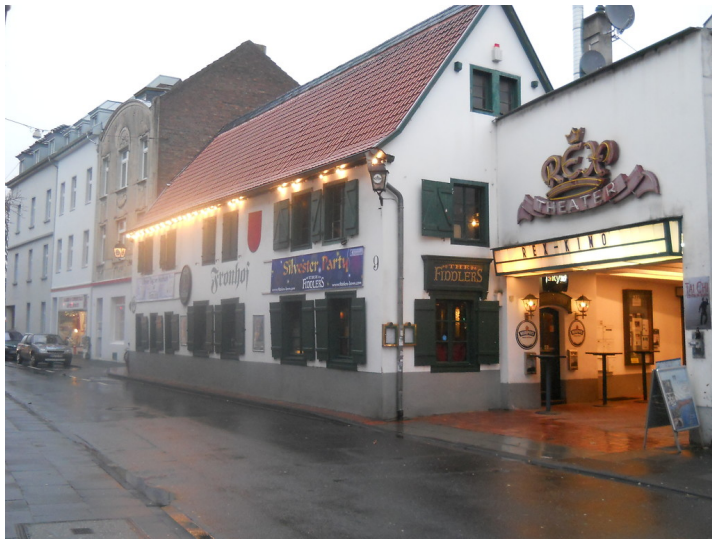
Der ehemalige Fronhof in Bonn-Eendenich, rechts daneben das "Rex"-Kino (2012).