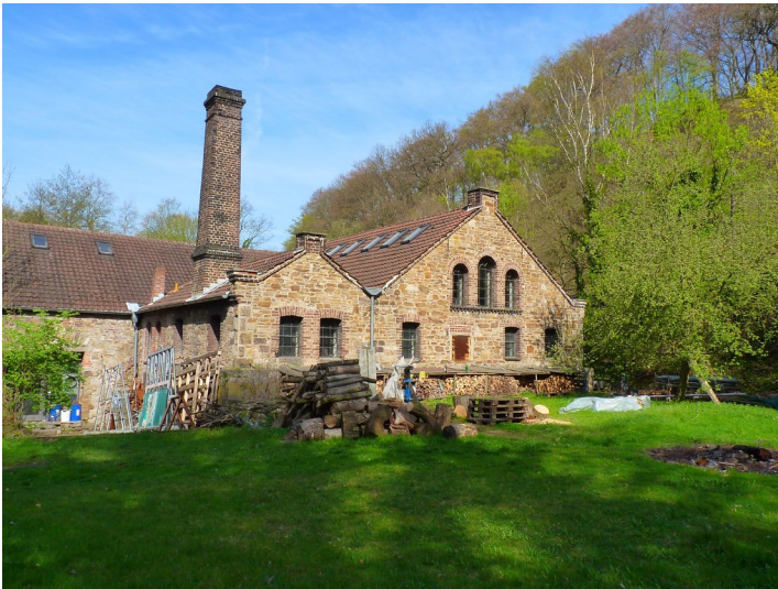
Kupferhammer im Deilbachtal (2011)