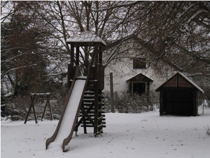
Abenteuerspielplatz und ehemaliges Wiegehäuschen auf der Hohengrub in Hunzel (2012).