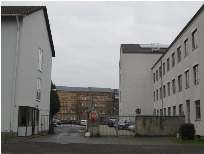
Alte und neue Gebäude der Ermeikeilkaserne gesehen von der Reuterstraße (2012)