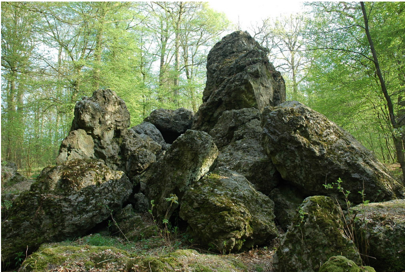
Die Gesteinsformation "Dicke Steine" bei Nümbrecht (2007).