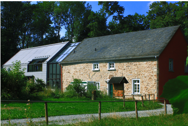
Das Rote Haus und das Landschaftshaus am Sitz der Biologischen Station Oberberg (2013).