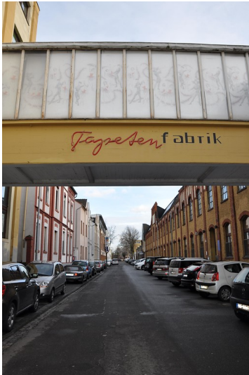
Namenszug der Tapetenfabrik Beuel