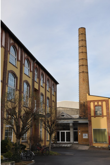
Schornstein und Gebäudeteil der ehemaligen Tapetenfabrik Beuel