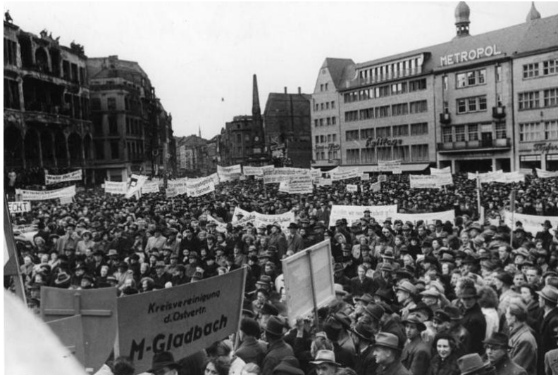
Historische Aufnahme von 1951: Eine Demonstration von Flüchtlings- und Vertriebenenverbänden auf dem Bonner Marktplatz, im Hintergrund rechts das Metropol-Kino-Theater.