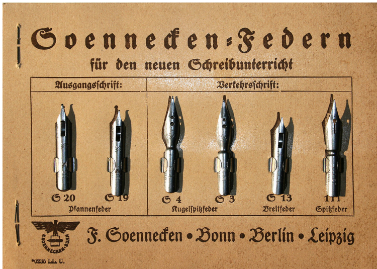
Eine Warenprobe Schreibfedern der Bonn-Poppelsdorfer Schreibwarenfirma Soennecken (1930er Jahre)