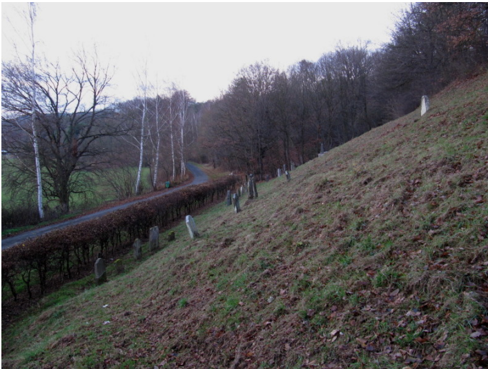
Jüdischer Friedhof am Ehrlichsberg in Miehlen (2012).