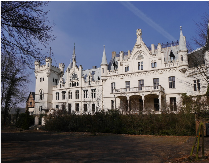
Frontansicht der Kommende Ramersdorf in Bonn-Beuel (2015)