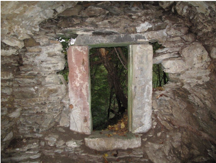
Die Felsenquelle zwischen Hof Salscheid und Kloster Arnstein bei Obernhof, hier der Blick von Innen zum Ausgang (2012).