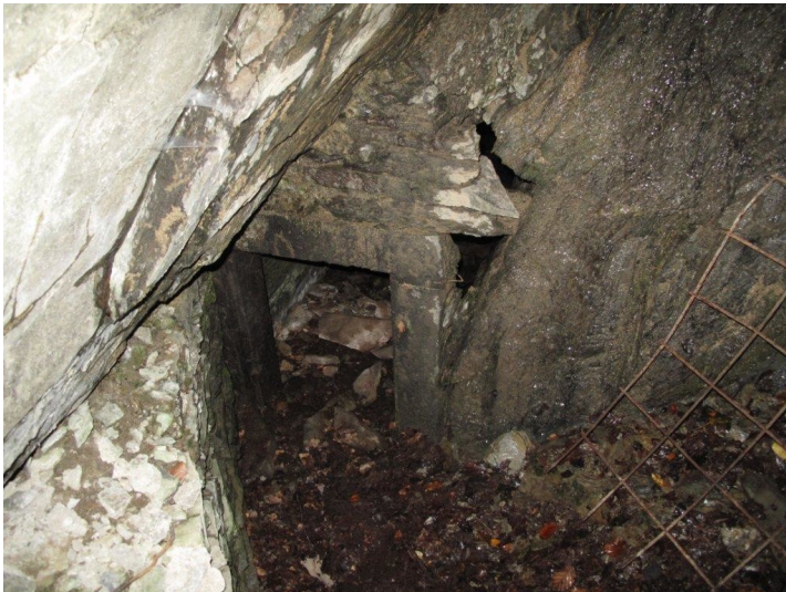
Stolleninneres der Felsenquelle zwischen Hof Salscheid und Kloster Arnstein bei Obernhof (2012).