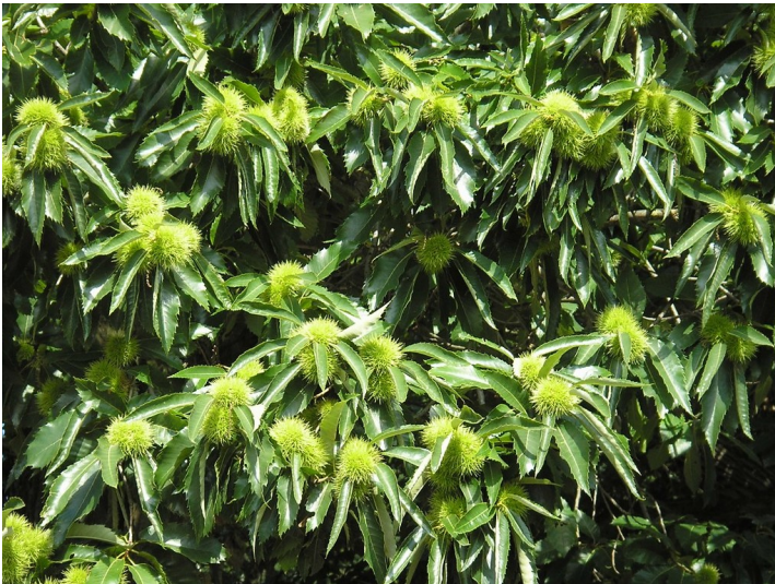
Teilansicht eines zu den Buchengewächsen (Fagaceae) zählenden Edel- oder Esskastanienbaumes ( Castanea sativa )