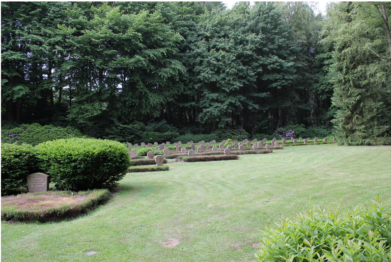
Ehrenfriedhof in Diersfordt (2012)