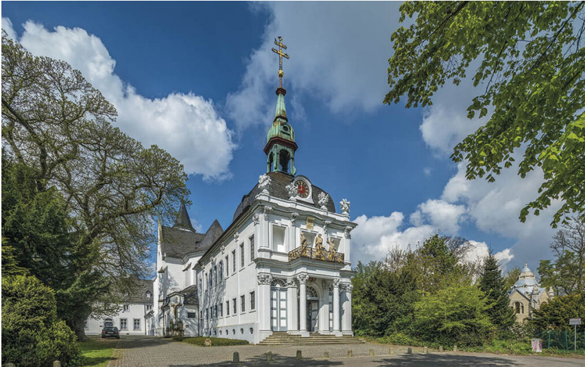
Heilige Stiege auf dem Kreuzberg Bonn (2019)