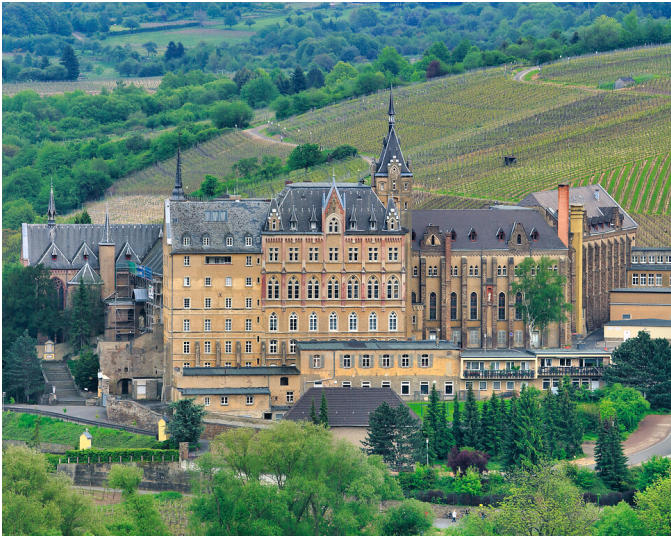
Kloster Calvarienberg in Bad Neuenahr-Ahrweiler (2005)