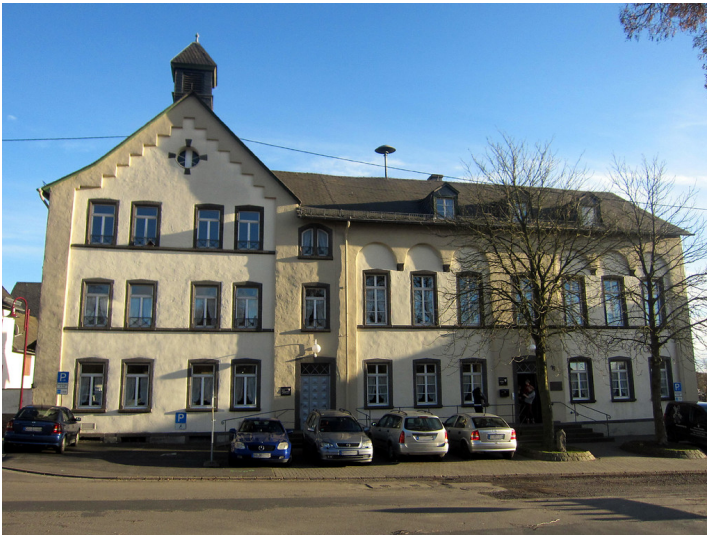
Alte Schule in Kaisersesch (2012).