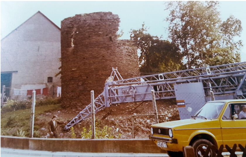
Arbeiten am "Alten Turm" der früheren Stadtbefestigung von Kaisersesch (um 1980), vermutlich im Zuge der in den Jahren 1980/81 erfolgten Renovierung des Bauwerks.