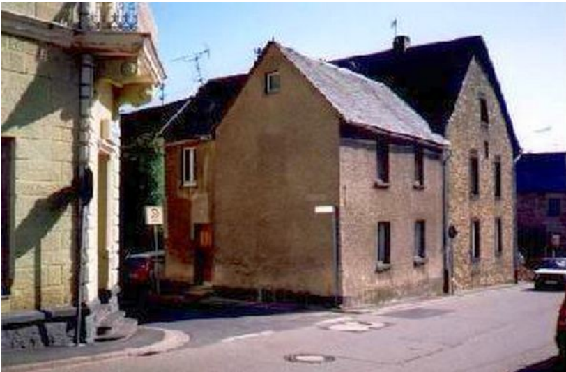
Ehemaliges Synagogengebäude in Kaisersesch in einer Aufnahme aus den 1970er Jahren