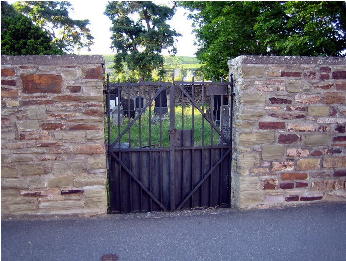
Jüdischer Friedhof Ahrweiler, Schützenstraße (2012)