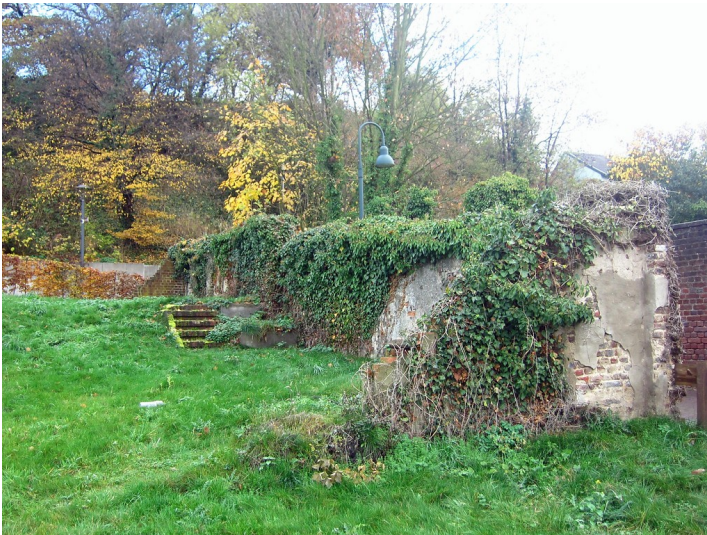
Ehemaliger Standort der Synagoge in der Synagogengasse Wassenberg (2012).