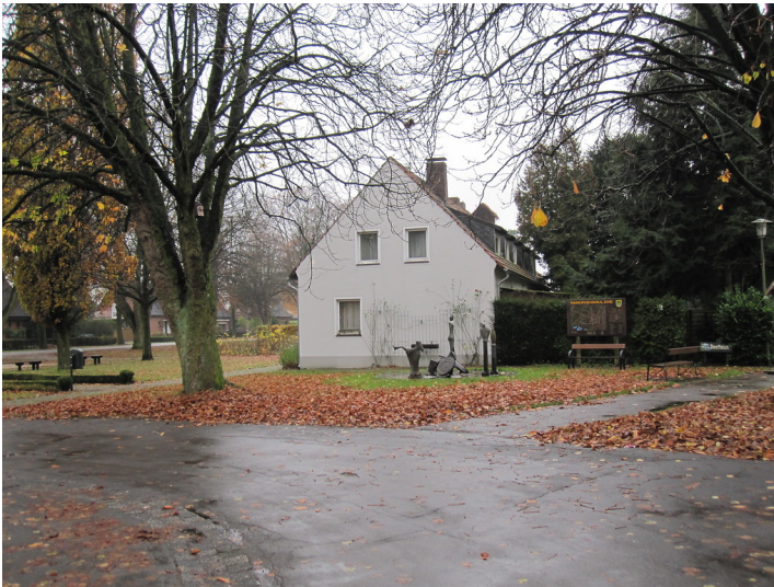
Wohnhaus und Grünfläche am Ortsrand von Nierswalde in Goch (2009)