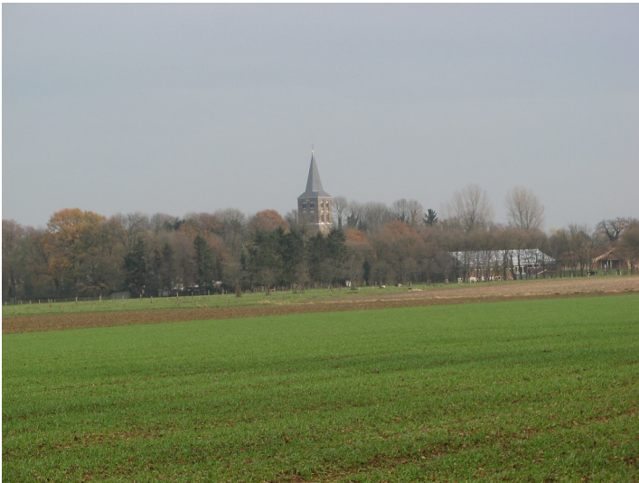
Blick auf Wegberg-Beeck von Nordwesten