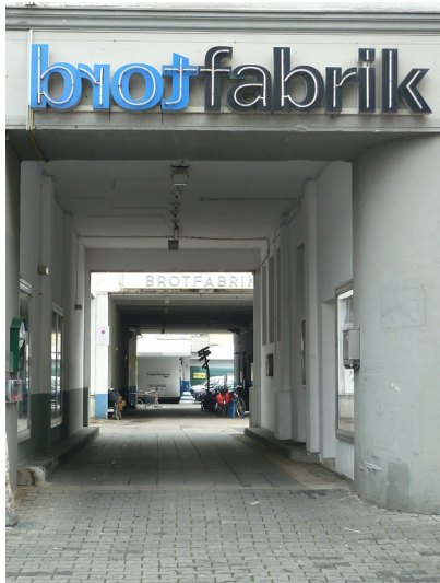
Außenansicht der Zufahrt zum Kulturzentrum "Brotfabrik Traumpalast e.V." in der Kreuzstraße in Bonn-Beuel (2012)