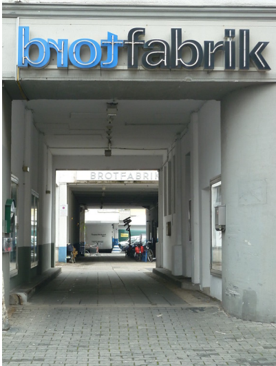
Außenansicht der Zufahrt zum Kulturzentrum "Brotfabrik Traumpalast e.V." in der Kreuzstraße in Bonn-Beuel (2012)