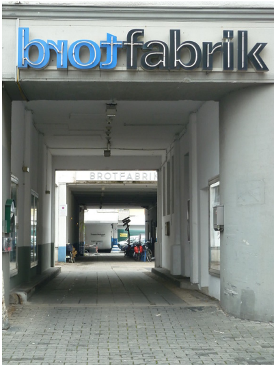
Außenansicht der Zufahrt zum Kulturzentrum "Brotfabrik Traumpalast e.V." in der Kreuzstraße in Bonn-Beuel (2012)