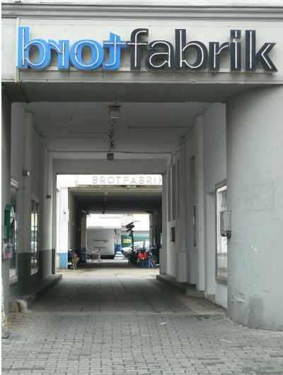
Außenansicht der Zufahrt zum Kulturzentrum "Brotfabrik Traumpalast e.V." in der Kreuzstraße in Bonn-Beuel (2012)