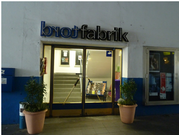
Eingang zum Kulturzentrum "Brotfabrik" mit Kulturkneipe, Theatersaal und Kinosälen (2012)