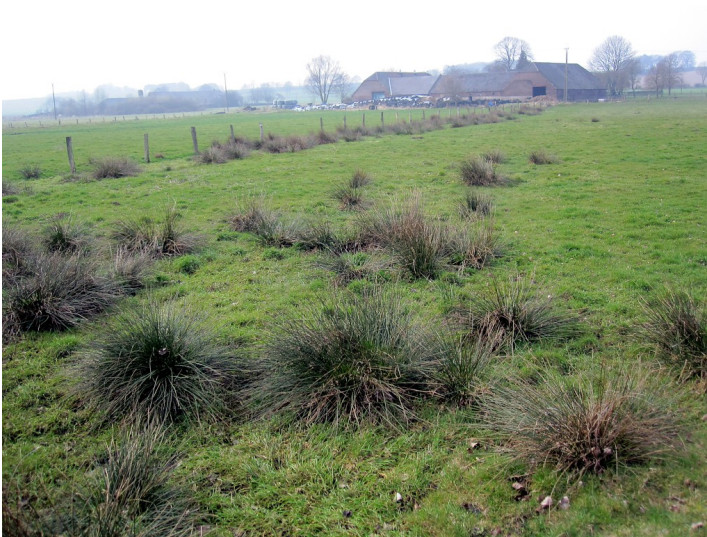
Grünland (Weide) in der Nähe des Paulshofs in Uedem (2011)