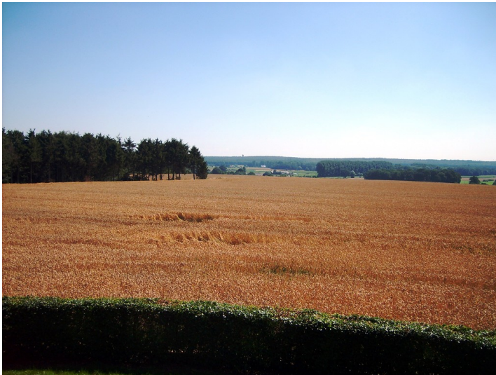
Ackerfläche im Uedemerfeld (2011)