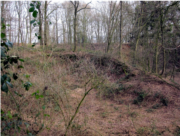
Aufgelassene ehemalige Sand- und Kiesgrube an der Hohen Mühle in Uedem (2011).