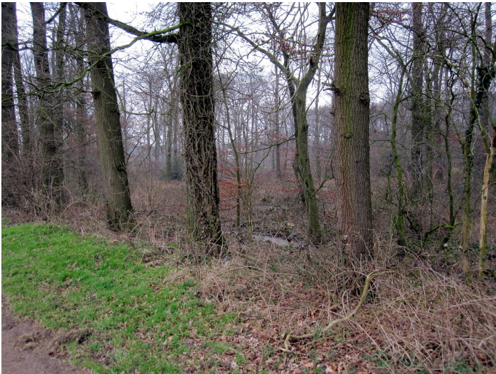
Wald bei Haus Kolk in Uedem (2011) Fotograf/Urheber: Burggraaff, Peter