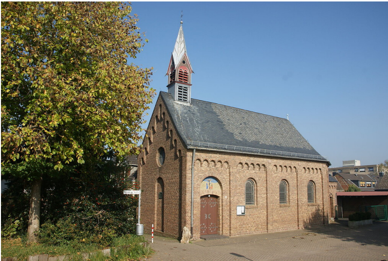
Kapelle Sankt Maria Magdalena in Frechen-Königsdorf