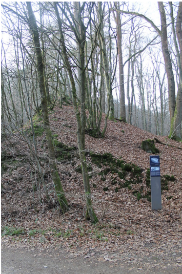
Eifgenburg (2016).