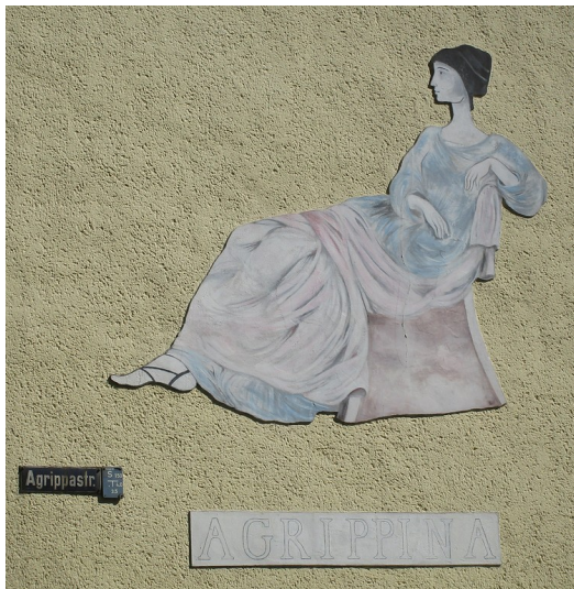
Darstellung der Agrippina, Gründerin der römischen Stadt Köln, an einer Hauswand in der Agrippastraße in Köln Altstadt-Süd (2019)