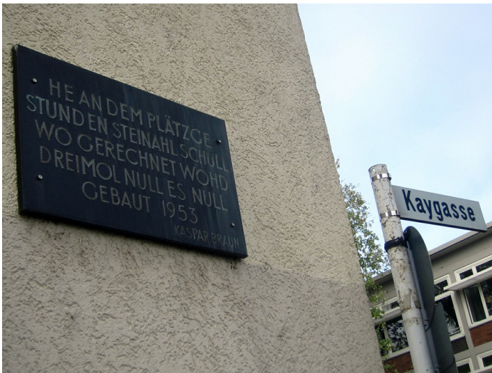
Der Standort der früheren Elementar-Freischule und späteren Hilfsschule, Ecke Großer Griechenmarkt / Kaygasse ("Kayjass Nr. 0") in Köln-Altstadt-Süd (2012).