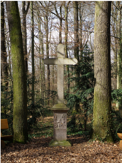
Euskirchen-Stotzheim, Hubertuskreuz