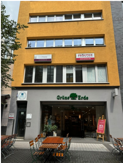
Standort des ehemaligen Hospitals Sankt Johann Baptist (2024)