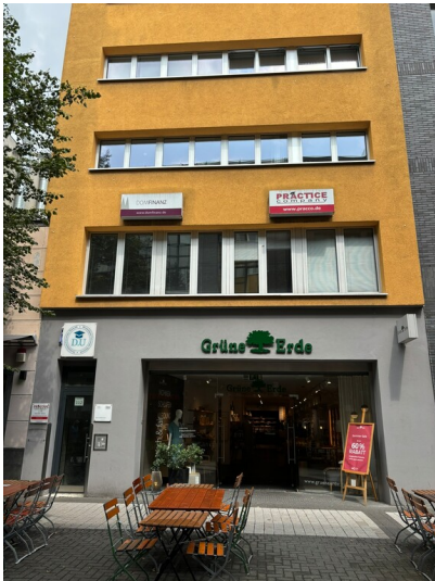
Standort des ehemaligen Hospitals Sankt Johann Baptist (2024)