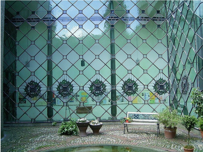
Kath. Pfarrkirche Herz Jesu in Schildgen