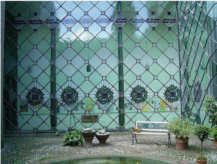
Kath. Pfarrkirche Herz Jesu in Schildgen