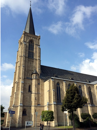
Herz-Jesu-Kirche in Euskirchen (2014).