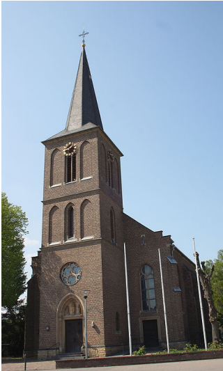
Katholische Pfarrkirche St. Martin in Stotzheim