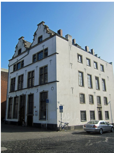
Haus Bachem (Haus im Bachem, Zum Großen Bachem, 2012)