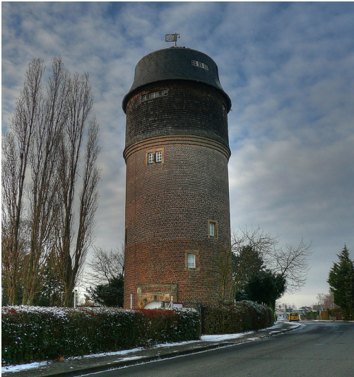
Wasserturm in Merzenich