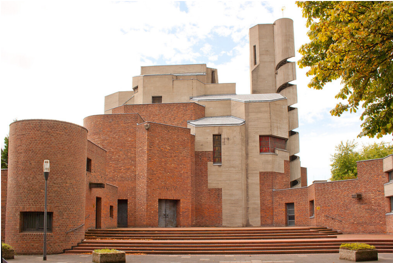
Pfarrkirche Christi Auferstehung in Köln-Lindenthal