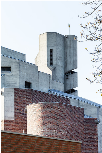
Detailansicht der katholischen Pfarrkirche Christi Auferstehung von Gottfried Böhm in Köln-Lindenthal (2020).